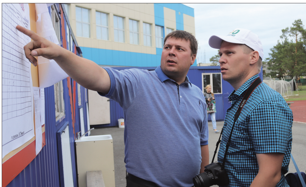
Нешуточная борьба разгорелась за призовые места в общекомандном зачете. Первое и второе места между собой поделили, уже по сложившейся традиции, Алапаевское МО и Горноуральский ГО. За третье место между собой конкурировали команды Ирбитского МО и Режевского ГО.